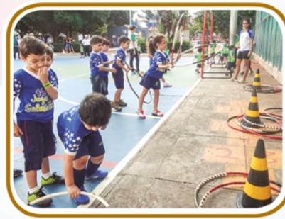
Jogando e aprendendo

Olhos atentos à mais uma bela Celebração de Páscoa.