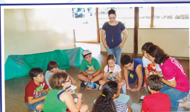
Sementinha: é o começo da construção de novas amizades e o fortalecimento dos valores básicos da vida familiar e social, bem como o início dos trabalhos em equipes.