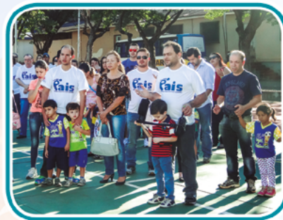
Festa da Família

Os alunos deram um show nas apresentações em homenagem ao Dia das Mães