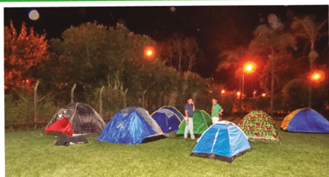
Acampamento Vinde e Vede: alunos do 8º e 9º ano do Fundamental fazem a experiência de acampar em um sítio sempre na presença dos educadores.