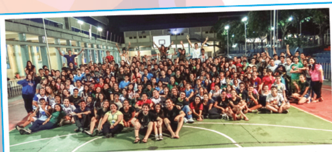
Jornada Masculina e Feminina: acontece quando o ensino médio e cursinho se encontram para reavivar o aprendizado dos bons valores salesianos.