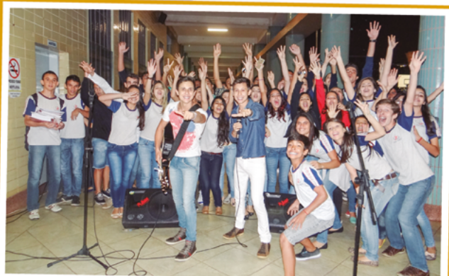
Sexta Cultural: pelo menos uma vez ao mês, os “amigos do Dom Bosco” que passaram como alunos, vêm mostrar o seu trabalho musical para os atuais alunos, revivem os bons momentos que viveram aqui e proporcionam um clima de família maravilhoso.