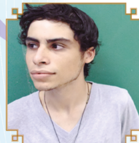
Gabriel Engenharia - USP / UFscar / UNESP / UFGD