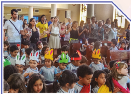
Celebração de Páscoa

Mais um momento lindo de união na Festa da Família!