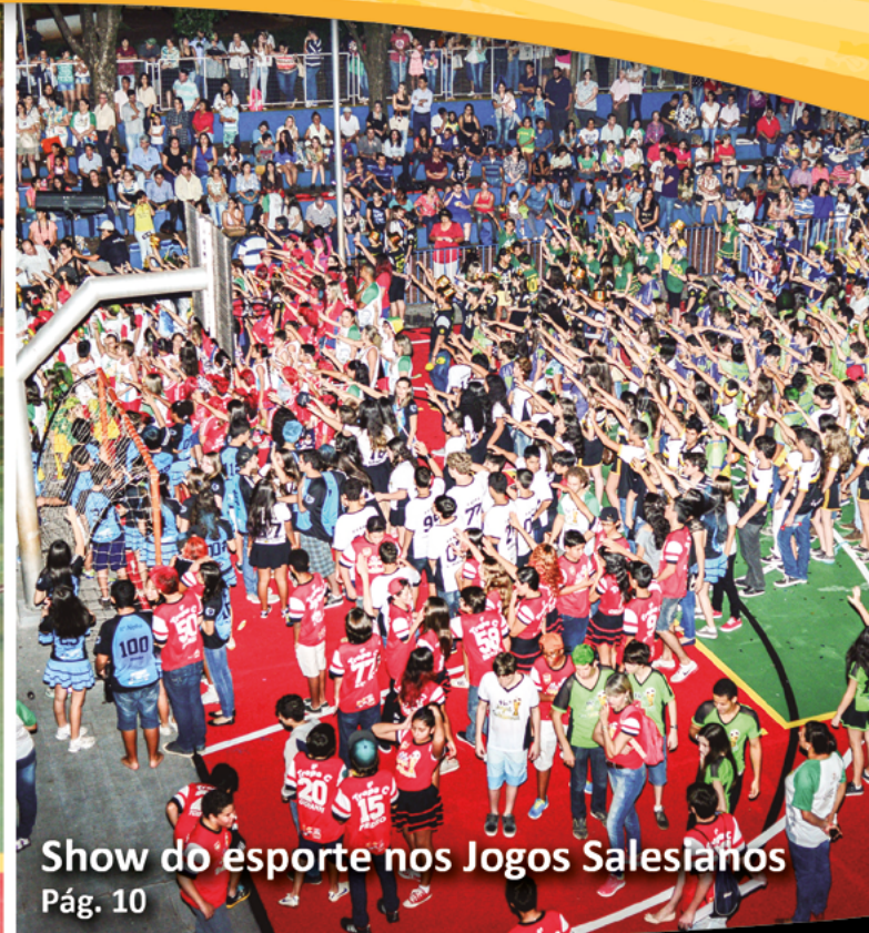
Show do esporte nos Jogos Salesianos Pág. 10

Show de aprovações: 472 em universidades federais - Pág. 8