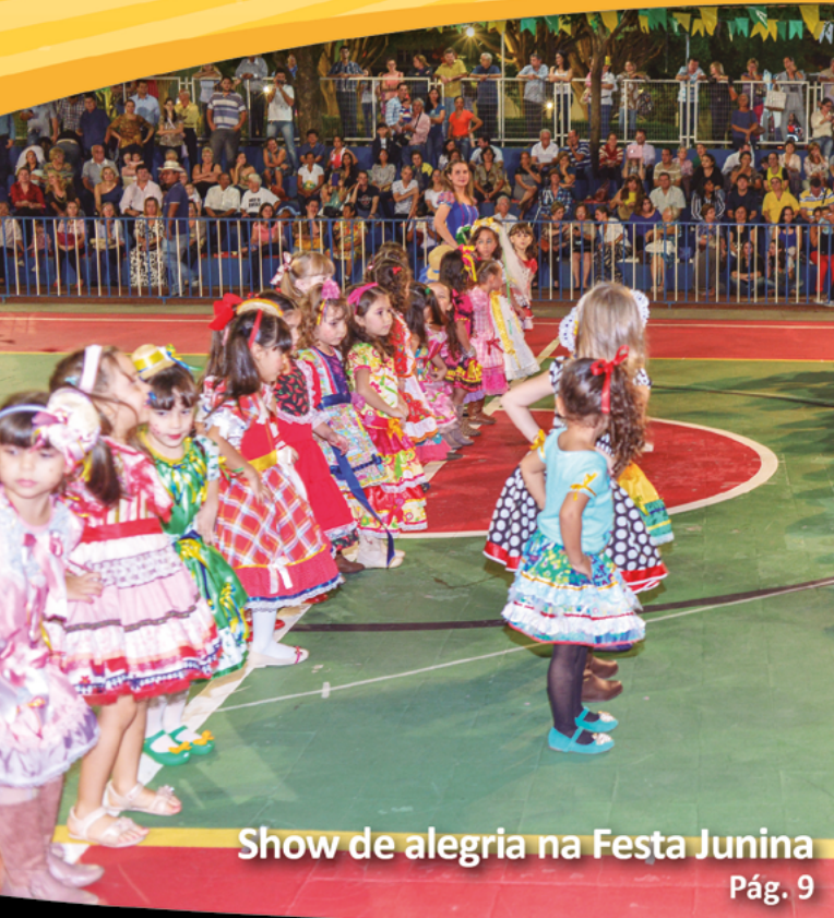
Show de alegria na Festa Junina Pág. 9