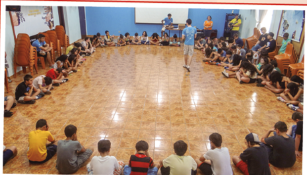
Crescer e Crer: um momento em que os alunos do 6º e 7º ano do Fundamental encontram os amigos fora do ambiente escolar.